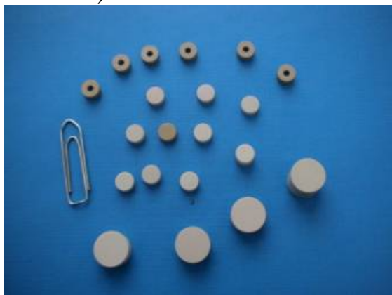
Fig. 4 Rezonatoare dielectrice