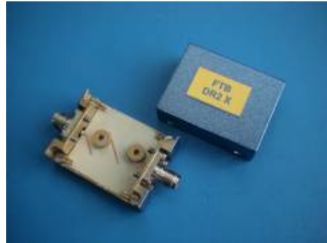
Fig. 2 Filtre de microunde