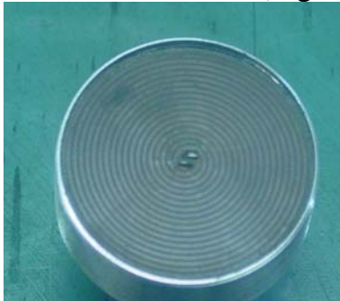
Fig. 1 Antena de microunde