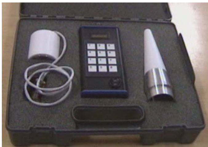
Fig. 5 Programator magnetic pentru focoase de proximitate și fuzante

Sisteme de artificii aeriene și terestre