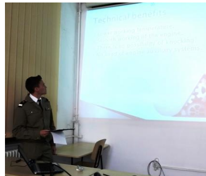
Participare la sesiuni de comunicari stiintifice

Absolvirea programului de studii oferă numeroase oportunități de practicare cu multiple satisfacții a profesiei de inginer în firme de renume din domeniul automobilelor. Studenții se pot înscrie, la cerere, în Societatea Inginerilor de Automobile din România – SIAR , organizație profesională care întrunește specialiști în domeniul autovehiculelor din industrie și mediul academic. După obținerea diplomei de licență, absolvenții pot continua studiile la programul de masterat – „ Echipamente și tehnologii în ingineria autovehiculelor - ETIA ”